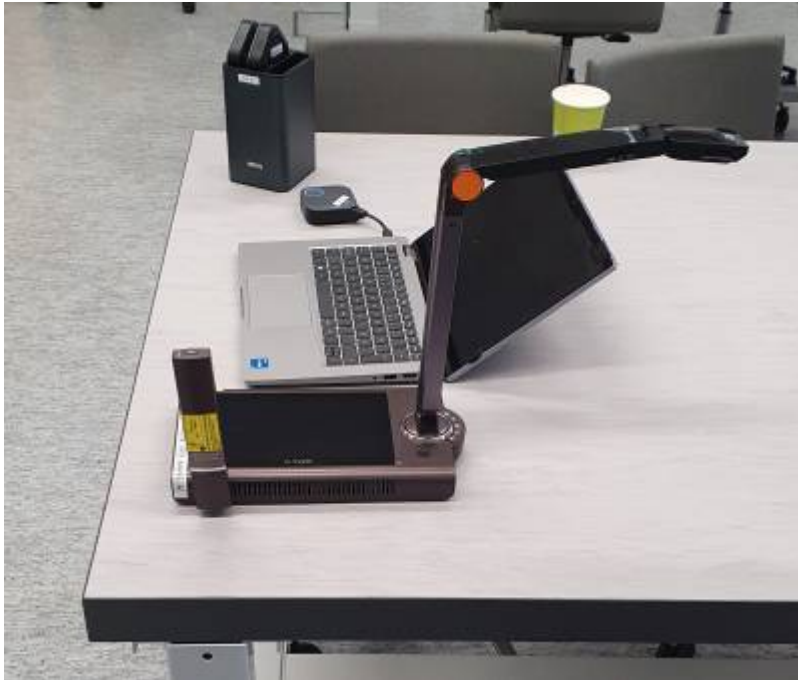
Physiklabor Bild 3