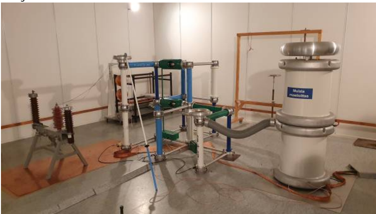
Energietechnik-Labor Bild 2