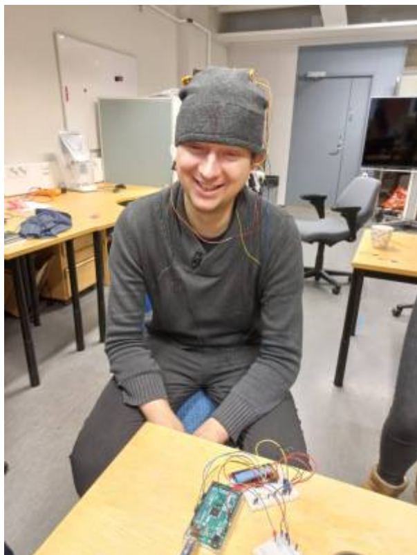
Fig. 1: Verwendung von in Kleidung eingebauten Elektroden an einem Probanden