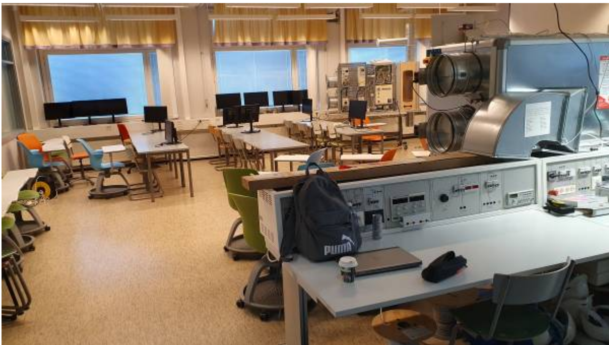
Energietechnik-Labor Bild 1