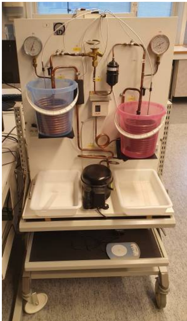
Physiklabor Bild 2