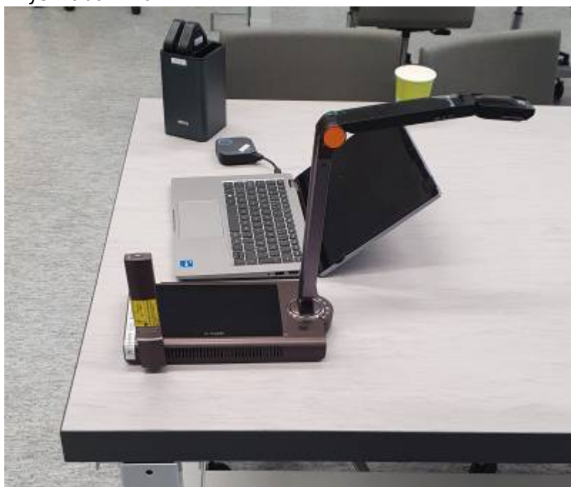
Physiklabor Bild 3