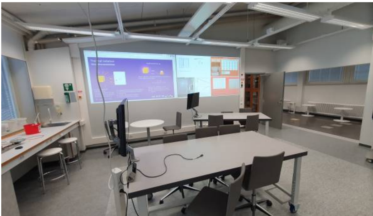
Physiklabor Bild 1