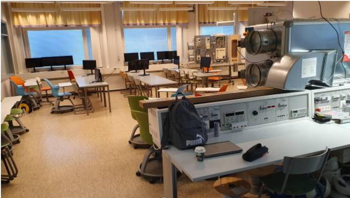
Energietechnik-Labor Bild 1