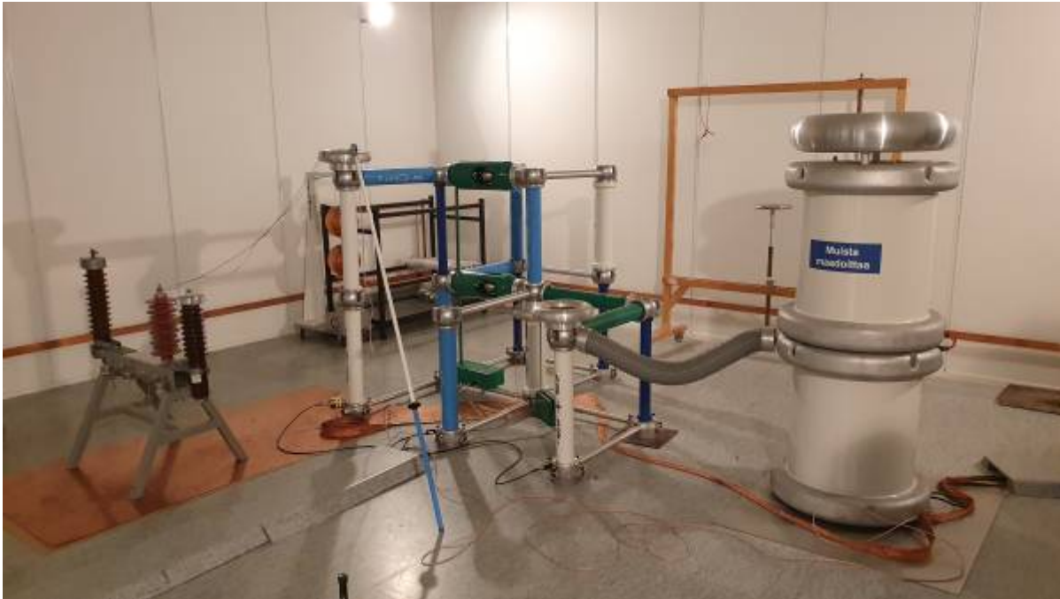
Energietechnik-Labor Bild 2