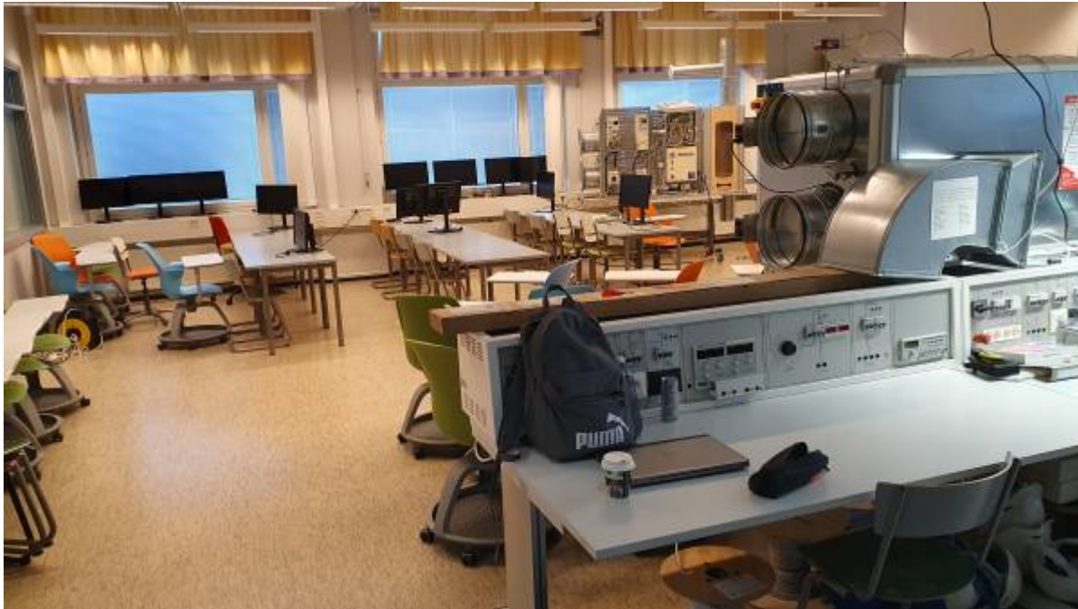
Energietechnik-Labor Bild 1