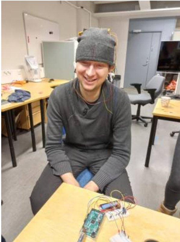
Fig. 1: Verwendung von in Kleidung eingebauten Elektroden an einem Probanden