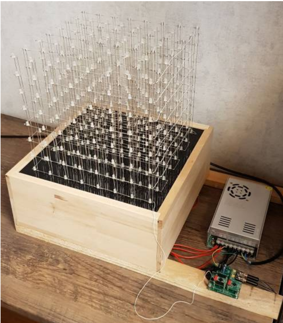
LED cube entwickelt im 3. Semester Mechatronik und Robotik