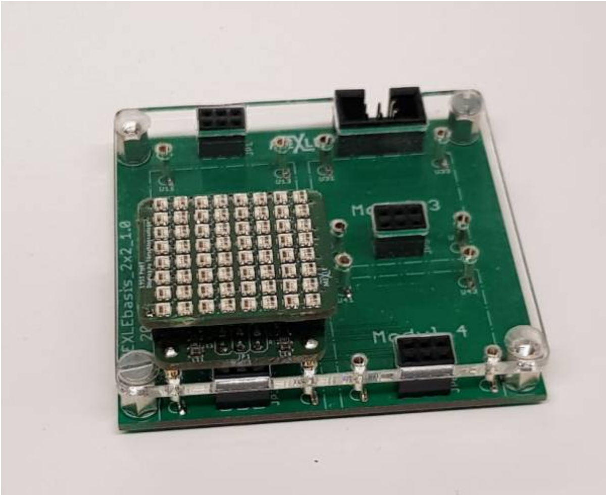
MEXLE Microcontroller Board mit selbst entwickeltem 8x8 Farb-LED Matrix (WS2812) auf 25x25mm 2