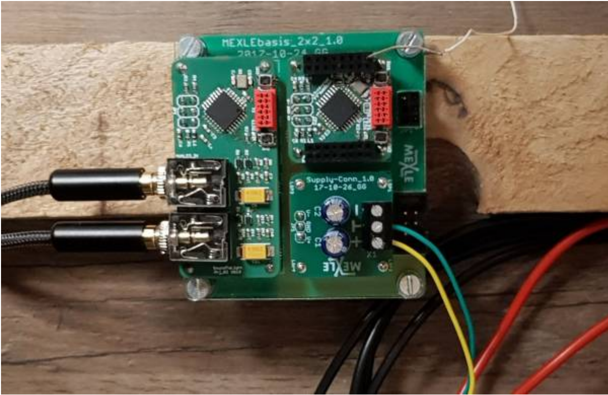
Elektronik des LED cube auf MEXLE2020 Basis (zwei ATmega328 zur Auswertung von Musiksignalen mit Eingangsfilter und FFT, sowie zur Ansteuerung des Würfels)