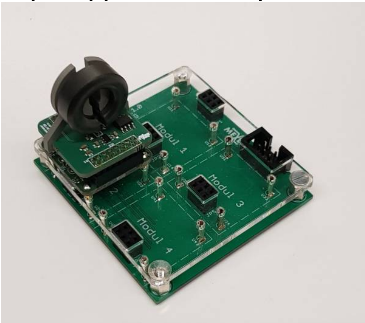
Stromsensor zur berührungslosen Messung bis 3A als Hookup auf einem Board mit ATmega328