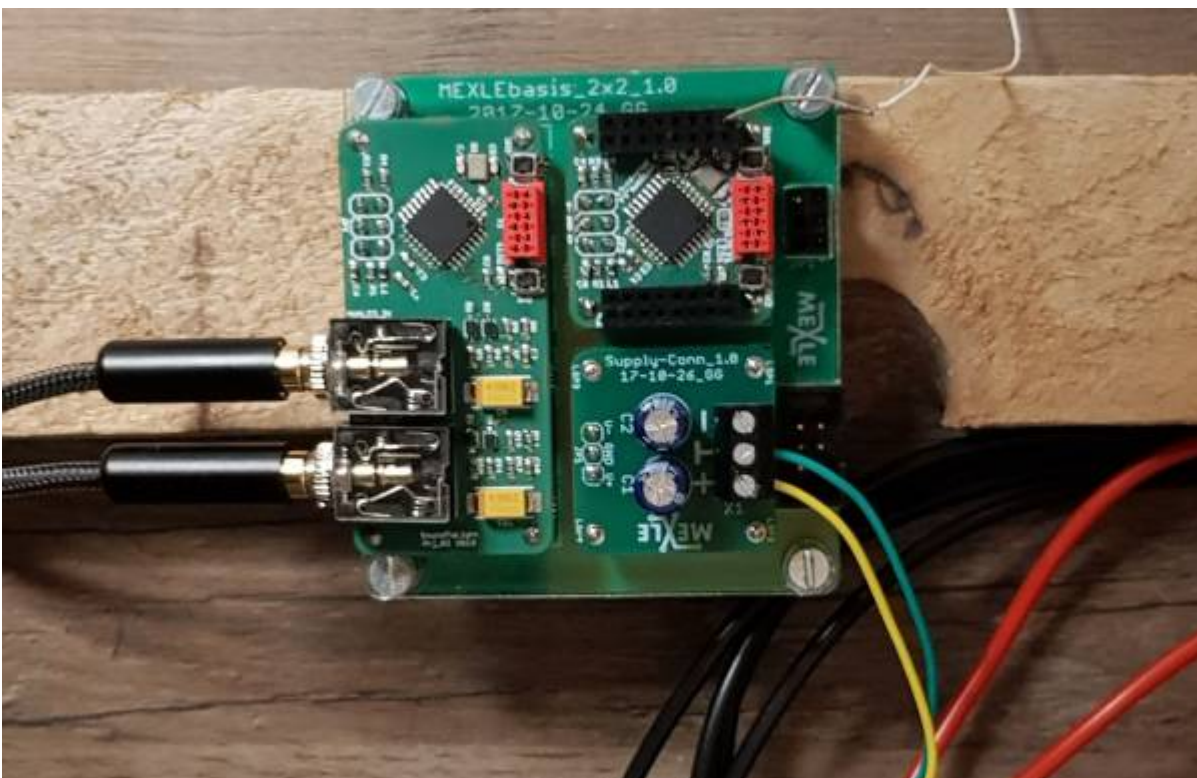
Elektronik des LED cube auf MEXLE2020 Basis (zwei ATmega328 zur Auswertung von