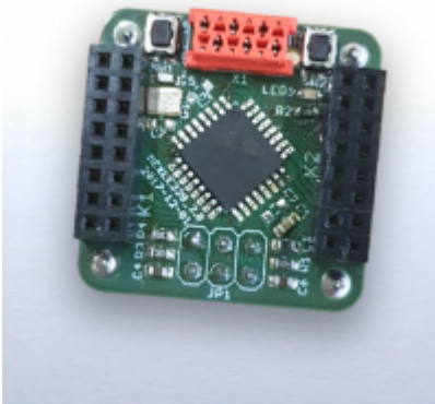
Fig. 1: fertige MMC 1x1 328PB Platine

Das Basis-Board dient als Grundlage, um Platinen zu entwickeln, welche auf den Modulträger (z.B. dem MCB 8x4 Modulträger ) aufgesteckt werden können. Die 1x1 Platine kann als Grundlage für weitere Projekte dienen. Dazu ist sie mit verschiedenen Schnittstellen ausgestattet, die im Folgenden nur kurz beschrieben werden.