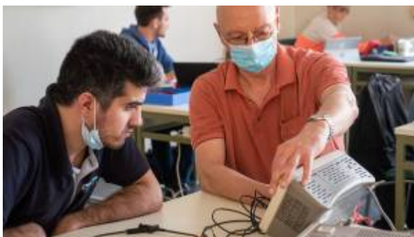
Fig. 1: ET1 Labor im SS2020