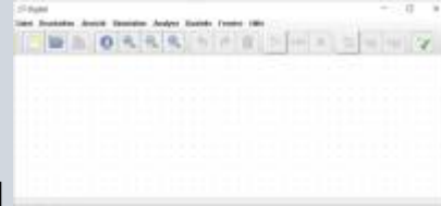
Fig. 1: Elemente des Programms Digital